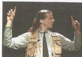
Engagierte Theaterarbeit mit Gehörlosen und mit taubblinden Kindern