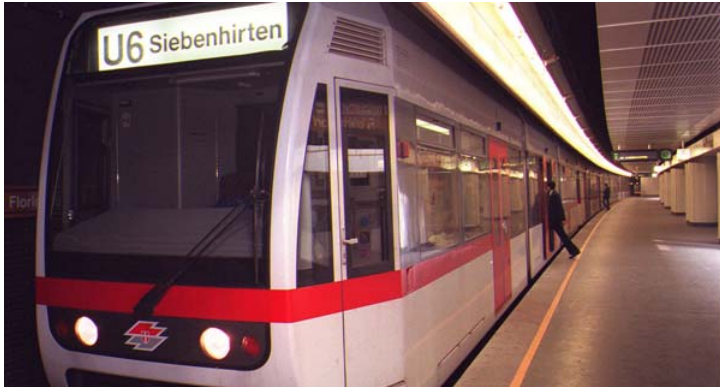
Während des Gehörlosentheaterfestivals werden Stücke in U-Bahn-Stationen aufgeführt.

Es kann schon sein, dass unglaubliche Szenen in der U-Bahn gehören zum Alltag gehören. Ende März kann es aber sein, dass dahinter tatsächlich eine Theatergruppe steckt, denn während des Gehörlosentheaterfestivals gibt es auch eine Kooperation mit den Wiener Linien.