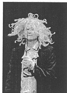
„Die Orchesterprobe“ Theaterstück in Pantomime von Gluchych Polska

Zuhörer am 8. September um 20.30 Uhr im Kultursaal Sillian.