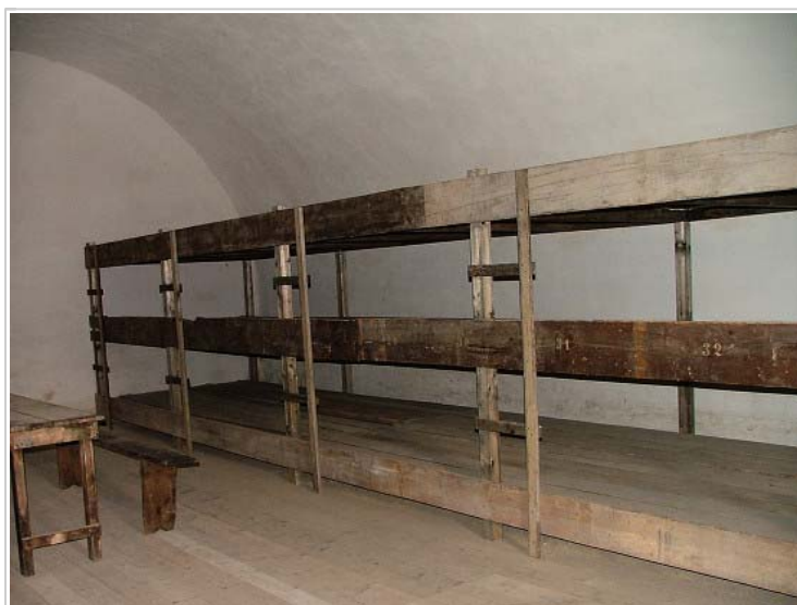
Small Fortress, Terezin, Czech Republic

Tříčlenná návštěva (vedoucí Švýcar Maurice Rossel a dva dáňští zástupci) absolvovala šestihodinovou prohlídku zkrášleným Terezínem a vrátila se zpět domů. Bohužel, s „dobrymi“ zprávami: Rossel, který po celou dobu návštěvy také fotografoval, napsal na Terezín v podstatě oslavný posudek, v němž tvrdil, že v Terezíně jsou snad lepší podmínky než v lecjakém „nežidovském“ městě, přiděly potravin jsou stejné jako v Protektorátu a - z Terezína prý nejedí transporty na Východ! Podvod se povedl. Nacisté byli spokojeni.