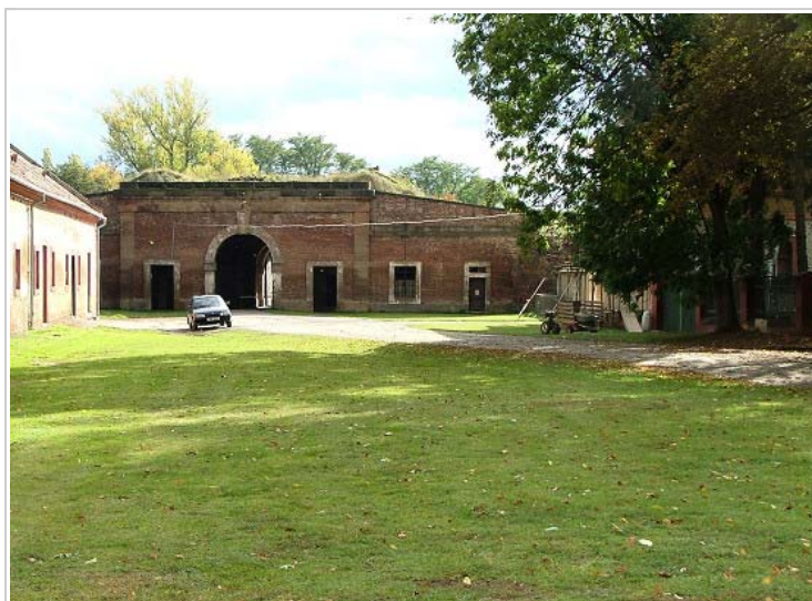
Small Fortress, Terezín, Czech Republic

Velmi špatné byly podmínky ubytovací. Lidé tu byli nuceni žít v hromadných ubikacích na trojpatrových palandách z neheblovaných prken. V dobách největší přeplněnosti musely být využívány kůlny na dvorcích, neizolované půdní prostory i vlhké prostory v hradbách (kasematy). Jedním z nejpálčivějších problémů byl pro takto ubytované (i když si zvykli na naprostou absenci soukromí) hmyz - vši, blechy, štěnice. Hmyzu nebylo možno se zbavit, byl všudypřítomný. Proto byla zřízena dezinfekční stanice, která k dezinfekci pokojů používala Cyklon B, dezinfekce však nikdy nemohla skoncovat s hmyzem nadobro, v podstatě ihned se vracel do míst, odkud byl vyhnán.