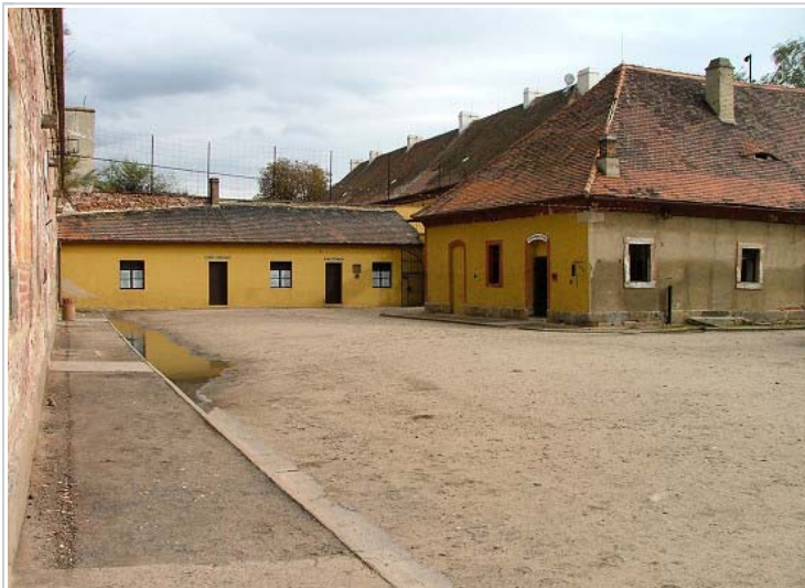
Small Fortress, Terezin, Czech Republic

Obyvatelstvo se v Terezíně měnilo v závislosti na transportních vlnách. Někdo zde pobyl pouze několik dní a byl ihned odtransportován dál, někdo zde vydržel pár měsíců, někdo rok, jen velmi málo vězňů mělo to „šťěstí“ strávit tu všechny čtyři roky. Z Terezína šlo na Východ celkem 63 transportů a s nimi odjelo asi 87 000 lidí. Z nich se zpět vrátilo asi 3600.