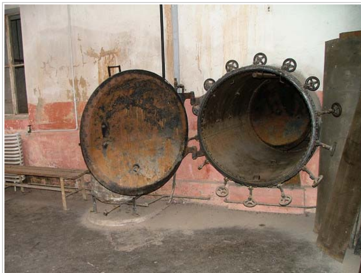
Small Fortress, Terezin, Czech Republic

Každý nový transport byl přiváděn na správní dvůr, kde vězně čekala až několikahodinová procedura spojená s ponižováním a týráním - po zaevidování musel vězeň odevzdat osobní doklady a cennosti. Poté obdržel vězeňský oděv (původně vězni dostávali zabavené uniformy československé armády, ženám byl ponechán civilní oděv), misku, lžičku a přikrývku. V celách I. až III. dvora se počet vězňů neustále měnil - pohyboval se mezi 60 - 90 lidmi. Spalo se na třípatrových palandách, na cele bylo umývadlo a záchod. Mnohem horší podmínky byly v celách IV. dvora - zde se tísnily stovky vězňů!