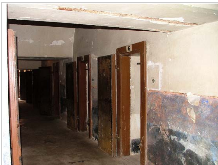
Small Fortress, Terezin, Czech Republic

Proto návštěvě (která proběhla 23. června 1944) předcházela akce nazvaná „zkrášlovací“ (probíhala téměř rok, od léta 1943). Z náměstí zmizel cirkusový stan i škaradý plot, celý prostor byl parkově upraven, v jednom rohu parku byl postaven hudební pavilónek, kde vyhrávala promenádní hudba. Na náměstí byla zřízena kavárna pro „obyvatele“ města (kam se ovšem mohli podívat jednou za 4-5 měsíců na speciální lístky a dostali pouze šálek náhražkové kávy!), okolo náměstí vyrostlo osm obchodů (s oděvy, kufrů, obuví a dokonce potravinami; ovšem: jednalo se spíše o vetešnictví, prodávaly se zde pouze věci, které byly předtím Židům odebrány ve šlojsce, v potravinách nebylo k dostání v podstatě nic). Dokonce byla zřízena „Banka židovské samosprávy“ (také na náměstí), která tiskla vlastní terezínské peníze [20] se židovským motivem a vězni začali dostávat naok plat za práci. Peníze sice mohly být ukládány v bance, neměly však žádnou reálnou hodnotu. V jednom parku bylo také zřízeno hřiště pro děti (pavilónek vymalovaný motivy exotických zvířat) a, světe div se, v Terezíně vznikla najednou i škola (když se tu však návštěva zastavila, visela pod tabulí „ŠKOLA“ cedulka „PRÁZDNINY“...) atd. atp.