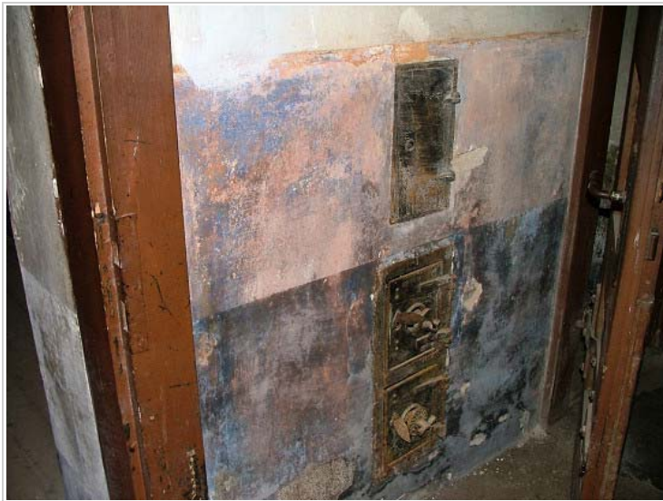
Small Fortress, Terezin, Czech Republic

Malá pevnost (něm. Kleine Festung) sloužila od června 1940 jako věznice gestapa (podřízena pankrácké věznici) určená pro politické vězně především z Protektorátu Čechy a Morava. Původně byla určena pouze pro muže, v období stanného práva po atentátu na Reinharda Heydricha zde byl zřízeno i ženské oddělení. Pro vězeňské účely sloužily nejprve dva dvory, později byl zřízen ženský dvůr a v letech 1943 až 1944 (pro zvýšení kapacity) byl vybudován IV. dvůr (pro muže).