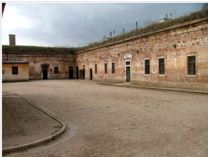
Small Fortress, Terezín, Czech Republic

V počátcích ghetta byl zakázán styk mužů a žen, po určitém uvolnění poměrů byl zákaz porušován. Vězni měli zakázán vstup na travnaté plochy a vůbec pohyb na některých místech (okolo budovy táborové komandantury, ubytovny esesáků apod.), dokonce nesměli chodit ani po chodnicích.