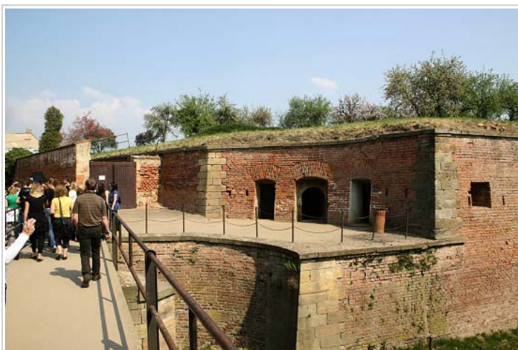
Fort – Sander ten Hoopen @ Flickr

Ghetto bylo záhy přeplněno lidmi. Průměrný počet vězňů za čtyři roky existence ghetta se pohyboval mezi 30 - 40 000 (před válkou zde žilo asi 7000 lidí včetně vojenské posádky), nejvyššího počtu bylo dosaženo v září 1942, kdy zde bylo napočítáno téměř 58 500 vězňených osob (tehdy zde umíralo v průměru 127 lidí denně!) [13] . Přeplněnosti odpovídaly i velmi špatné hygienické, ubytovací, stravovací a další podmínky, které měly za důsledek vysokou úmrtnost v ghettu: každý čtvrtý vězeň zemřel přímo v Terezíně!