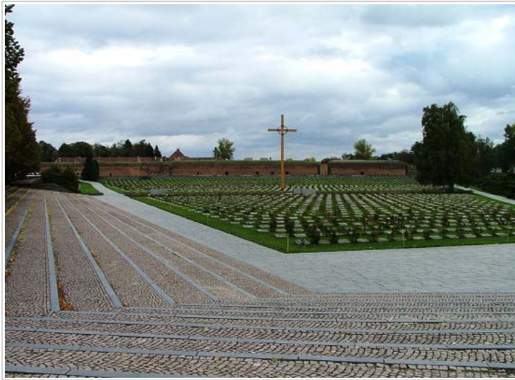
Small fortress, Terezín, Czech Republic