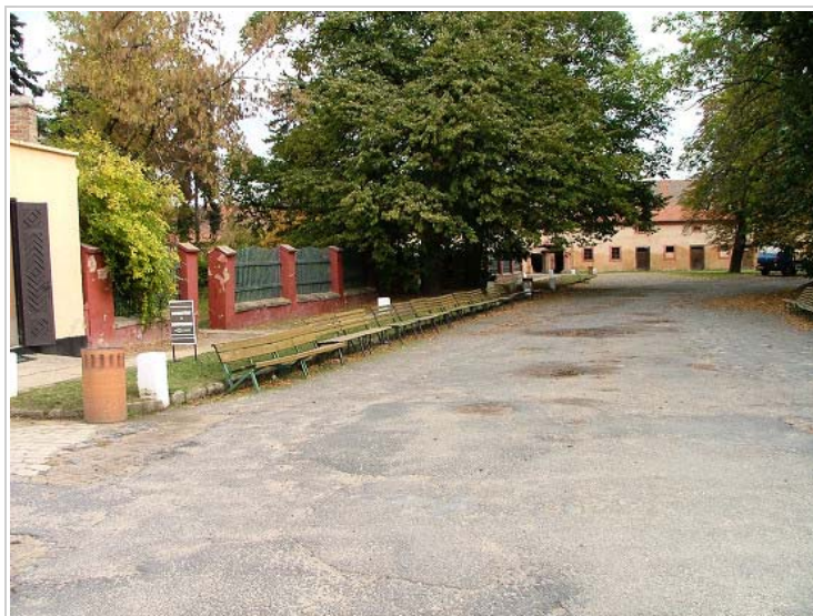
Small fortress, Terezín, Czech Republic