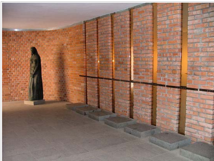
Small Fortress, Terezin, Czech Republic

Za dobu pěti let existence věznice sem bylo umístěno na 27 000 mužů a 5000 žen - převážně (z 90 procent) se jednalo o české politické vězně (organizace: Obrana národa, PÚ, PVVZ, ÚVOD, komunistů; odbojové a partyzánské skupiny: Kapitán Nemo , Národní sdružení československých vlastenců , Druhá lehká tajná divize , Mistr Jan Hus ad.; a také: funkcionáři Sokola, příbuzní a podporovatelé atentátníků včetně 84 studentů roudnických středních škol), cizích státních příslušníků tu bylo na 2 500 - především občané bývalého SSSR, Britové, Poláci, Francouzi a Němci (mezi nimi několik set sovětských a britských válečných zajatců). Věznice měla průchozí charakter, počet vězňů se neustále měnil, vězni byli odesíláni k soudům, do jiných věznic a káznic (nejčastěji do Drážďan, Bautzenu, Zwickau, Bayreuthu, Waldheimu, Straubingu, Brachu a Berlína) či do jiných koncentračních táborů (Buchenwald, Auschwitz-Birkenau, Flossenbürg, Mauthausen) a přicházeli vězni noví.