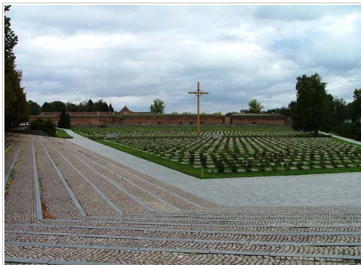
Small fortress, Terezín, Czech Republic