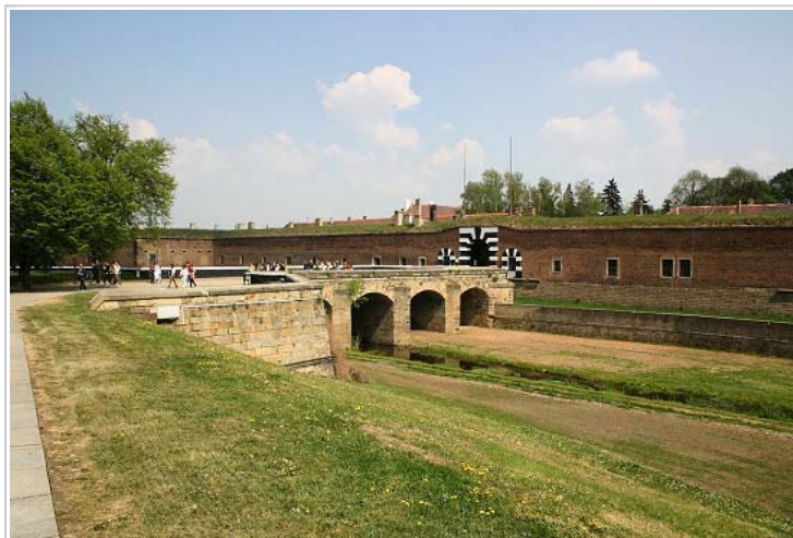
Poort naar Kleine Vesting (strafkamp van de Gestapo)

Koncentrační tábor Terezín je souhrnné označení nacistických represivních zařízení zřízených za druhé světové války za pevnostními zdmi a valy Terezína. Jednalo se o věznici gestapa (v Malé pevnosti, od června 1940) a o židovské ghetto (v Hlavní pevnosti, od listopadu 1941).