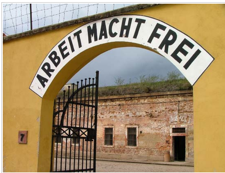
Small Fortress, Terezín, Czech Republic – Emmanuel Dyan @ Flickr

V Terezíně bylo v průběhu čtyř let internováno sedm národností: Češi, Němci, Rakušané, Nizozemci, Dánové a na konci války Maďaři a Slováci. Celkem tudy prošlo asi 140 000 lidí označených podle Norimberských zákonů za Židy, z nich téměř 35 000 zemřelo přímo v ghettu pod vlivem velmi špatných životních podmínek. Na samém konci války přijelo ve zbědovaném stavu na 15 000 lidí různých národností z evakuačních transportů a pochodů smrti (tedy z vyhlazovacích a koncentračních táborů na Východě rušených před postupující frontou). Ti s sebou přinesli epidemii skvrnitého tyfu - již po ukončení všech bojů zde tak ještě do konce května 1945 umírali další zbytečné oběti holocaustu (asi 1500 lidí včetně ruských a českých zdravotníků) [7] . Celkem tak terezínským ghettem prošlo asi 155 000 lidí, z nich nepřežilo 2. světovou válku 118 000. Osvobození Terezína proběhlo hladce a bez bojů. 1. května 1945 byla kontrola nad táborem převedena na Červený kříž, 5. května utíkají poslední nacisté před blížící se frontou a 8. května 1945 přijíždějí první sovětské jednotky. [8]