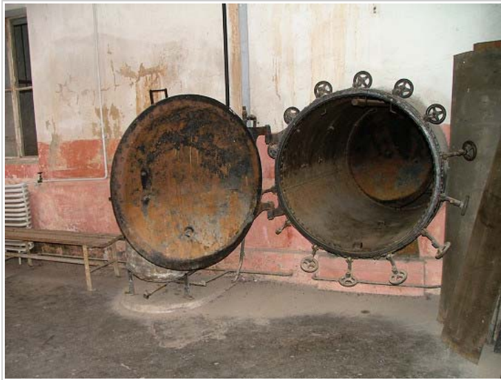
Small Fortress, Terezín, Czech Republic

Každý nový transport byl přiváděn na správní dvůr, kde vězně čekala až několikahodinová procedura spojená s ponižováním a týráním - po zaevidování musel vězeň odevzdat osobní doklady a cennosti. Poté obdržel vězeňský oděv (původně vězni dostávali zabavené uniformy československé armády, ženám byl ponechán civilní oděv), misku, lžičku a přikrývku. V celách I. až III. dvora se počet vězňů neustále měnil - pohyboval se mezi 60 - 90 lidmi. Spalo se na třípatrových palandách, na cele bylo umývadlo a záchod. Mnohem horší podmínky byly v celách IV. dvora - zde se tisily stovky vězňů!