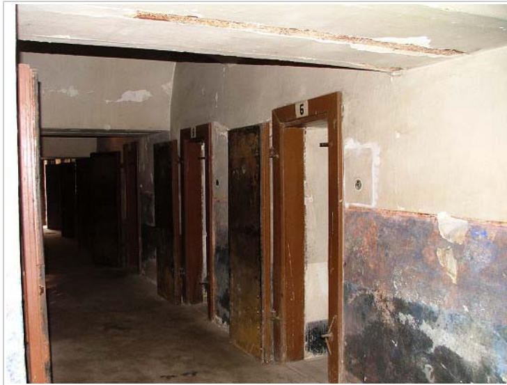
Small Fortress, Terezín, Czech Republic

Proto návštěvě (která proběhla 23. června 1944) předcházela akce nazvaná „zkrášlovací“ (probíhala téměř rok, od léta 1943). Z náměstí zmizel cirkusový stan i škaradý plot, celý prostor byl parkově upraven, v jednom rohu parku byl postaven hudební pavilónek, kde vyhrávala promenádní hudba. Na náměstí byla zřízena kavárna pro „obyvatele“ města (kam se ovšem mohli podívat jednou za 4-5 měsíců na speciální lístky a dostali pouze šálek náhražkové kávy!), okolo náměstí vyrostlo osm obchodů (s oděvy, kufrů, obuví a dokonce potravinami; ovšem: jednalo se spíše o vetešnictví, prodávaly se zde pouze věci, které byly předtím Židům odebrány ve šlojsce, v potravinách nebylo k dostání v podstatě nic). Dokonce byla zřízena „Banka židovské samosprávy“ (také na náměstí), která tiskla vlastní terezínské peníze [20] se židovským motivem a vězni začali dostávat naok plat za práci. Peníze sice mohly být ukládány v bance, neměly však žádnou reálnou hodnotu. V jednom parku bylo také zřízeno hřiště pro děti (pavilónek vymalovaný motivy exotických zvířat) a, světe div se, v Terezíně vznikla najednou i škola (když se tu však návštěva zastavila, visela pod tabulí „ŠKOLA“ cedulka „PRÁZDNINY“...) atd. atp.