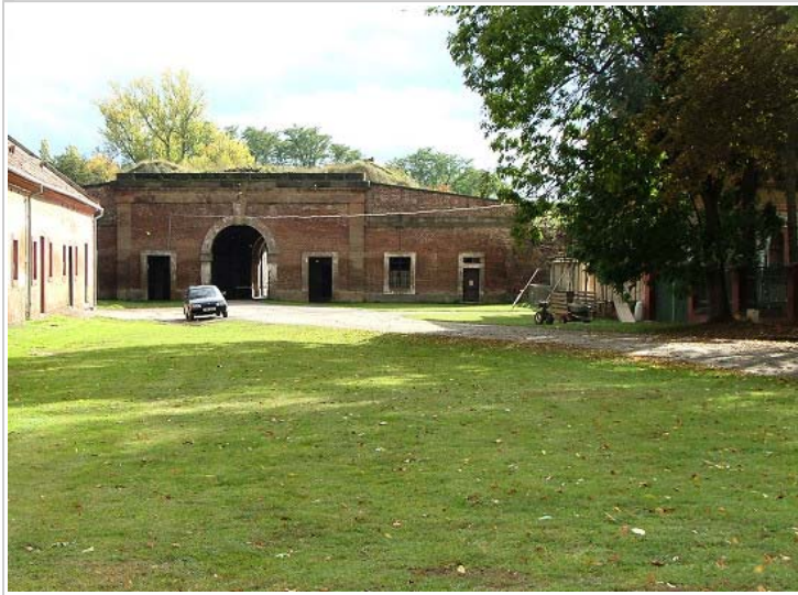
Small Fortress, Terezín, Czech Republic

Velmi špatné byly podmínky ubytovací. Lidé tu byli nuceni žít v hromadných ubikacích na trojpatrových palandách z neheblovaných prken. V dobách největší přeplněnosti musely být využívány kůlny na dvorcích, neizolované půdní prostory i vlhké prostory v hradbách (kasematy). Jedním z nejpálčivějších problémů byl pro takto ubytované (i když si zvykli na naprostou absenci soukromí) hmyz - vši, blechy, štěnice. Hmyzu nebylo možno se zbavit, byl všudypřítomný. Proto byla zřízena dezinfekční stanice, která k dezinfekci pokojů používala Cyklon B, dezinfekce však nikdy nemohla skoncovat s hmyzem nadobro, v podstatě ihned se vracel do míst, odkud byl vyhnán.