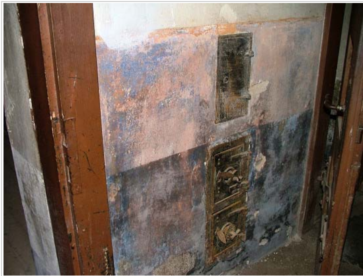
Small Fortress, Terezín, Czech Republic

Malá pevnost (něm. Kleine Festung) sloužila od června 1940 jako věznice gestapa (podřízena pankrácké věznici) určená pro politické vězně především z Protektorátu Čechy a Morava. Původně byla určena pouze pro muže, v období stanného práva po atentátu na Reinharda Heydricha zde byl zřízeno i ženské oddělení. Pro vězeňské účely sloužily nejprve dva dvory, později byl zřízen ženský dvůr a v letech 1943 až 1944 (pro zvýšení kapacity) byl vybudován IV. dvůr (pro muže).