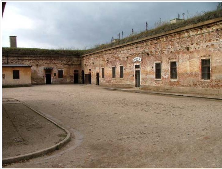
Small Fortress, Terezín, Czech Republic

V počátcích ghetta byl zakázán styk mužů a žen, po určitém uvolnění poměrů byl zákaz porušován. Vězni měli zakázán vstup na travnaté plochy a vůbec pohyb na některých místech (okolo budovy táborové komandantury, ubytovny esesáků apod.), dokonce nesměli chodit ani po chodnících.