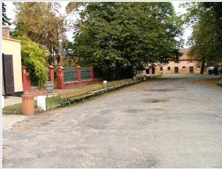
Small fortress, Terezín, Czech Republic