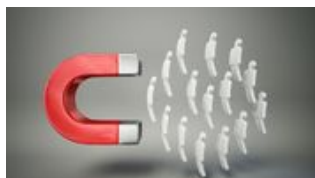
Muss Digitalisierung distanzlos sein?