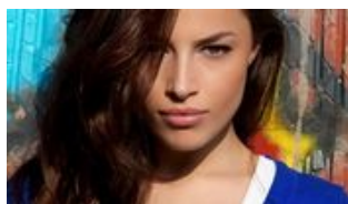
Singles in Österreich