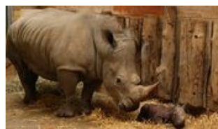
Nashorn-Nachwuchs im Salzburger Zoo