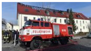
Nach NPD-Protesten: Feuer in deutschem Flücht...