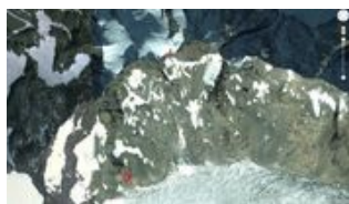
Eugendorfer starb unter Lawine: Überlebende...