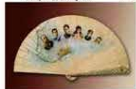
предмет | музей | увеличить | лаял